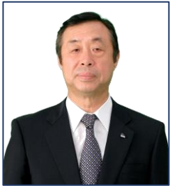
リードグループ 代表取締役